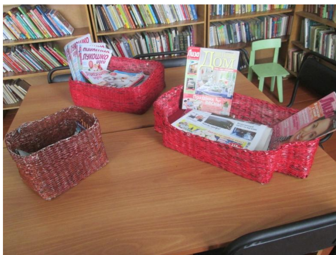
Готовые корзины для журналов и газет.

Их можно использовать и для домашних животных.