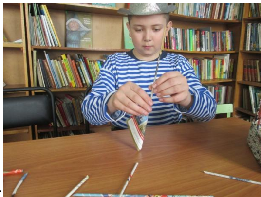
Кручение бумажных палочек